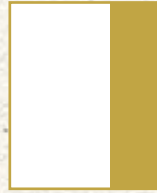
1/3 Seite hoch B 55 x H 216*